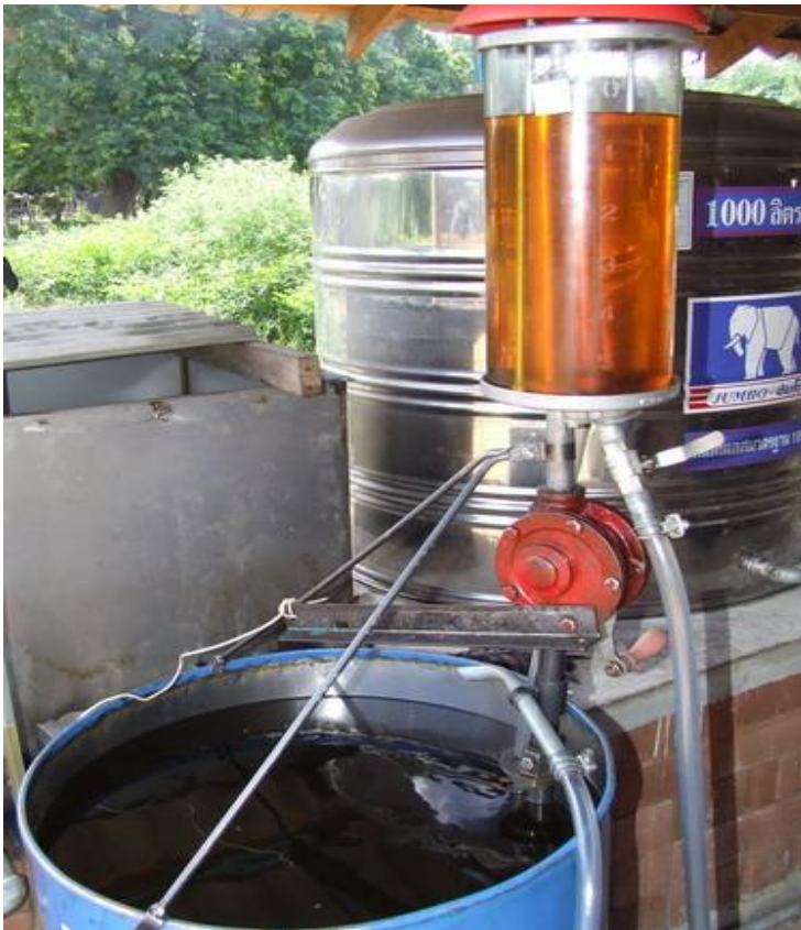
พลังงานไบโอดีเซล