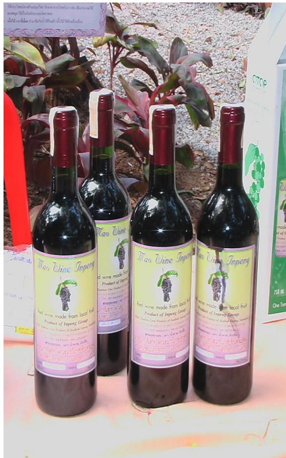
การจัดการผลผลิต ไวน์หมากเม่าอินแปง