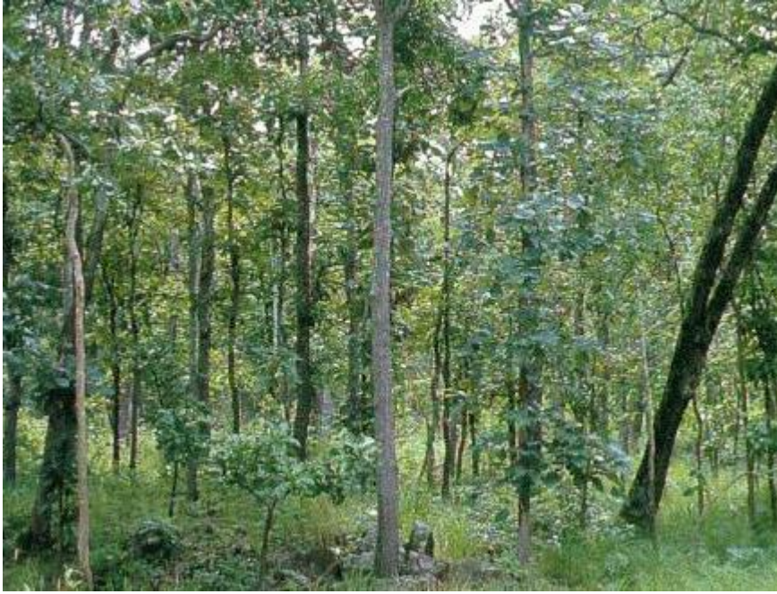
ทุนและบ้านาญ (ภาพจาก www.thaigoodview.com/ )