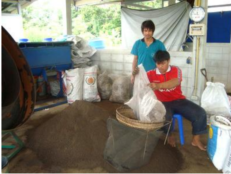
ทำปุ๋ยหมักชีวภาพ