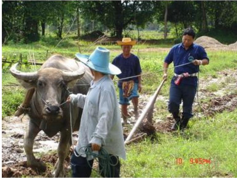
การจัดการด้านแรงงาน