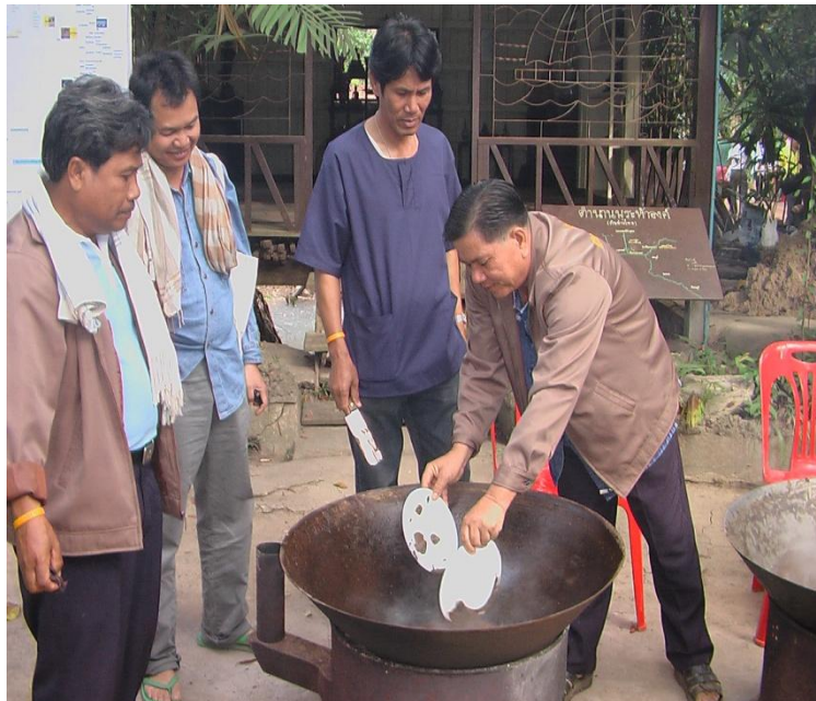
การทดลองละเอียด (ภาพ: การทำน้ำมันสมุนไพร ที่สวนวนเกษตรชะเชิงเตรา)